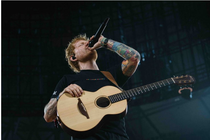
Ed Sheeran 在其 Mathematics 巡演中使用 Digital 6000 系列手持式话筒（搭配 MM 435 话筒头）进行演唱

有多个扩音系统，我们不希望有声音外泄的情况发生。尽管 Ed 很多时候都离话筒很近，他使用话筒的方式还是十分多变的，而 435 话筒头支持更广的拾音范围。”